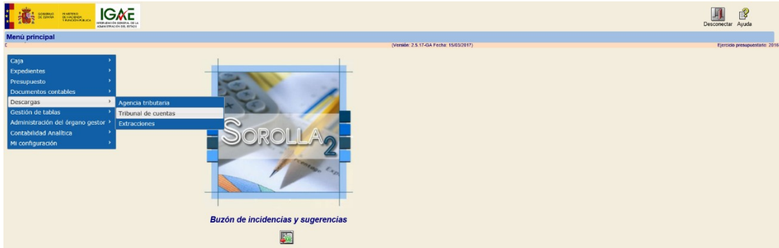
Ilustración 2: Fichero para el Tribunal de Cuentas desde Órgano Gestor